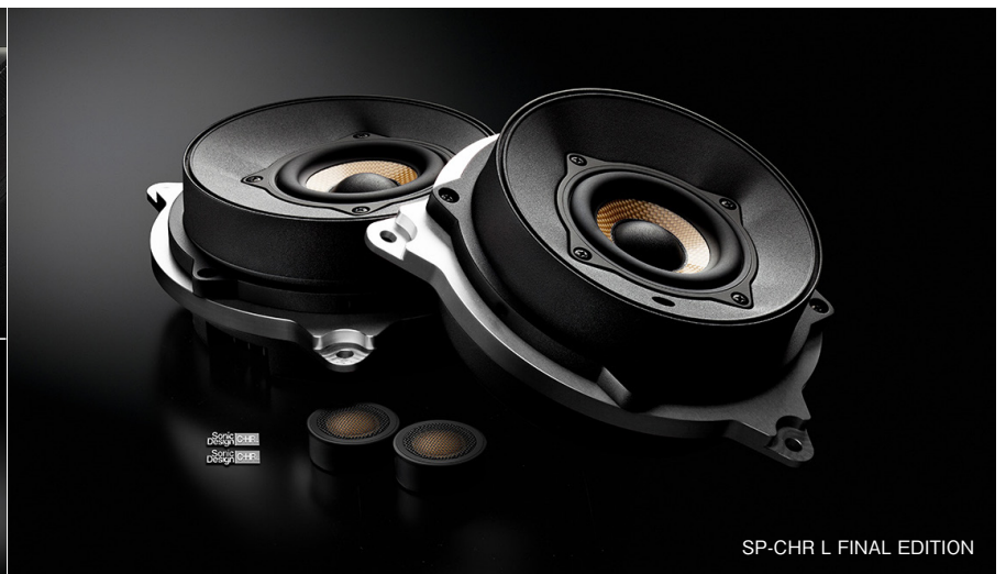
SP-CHR L FINAL EDITION

車両への装着画像(左上)は合成によるものです。製品は純正グリル内に装着されるため、実際にはスピーカーユニットは見えません。