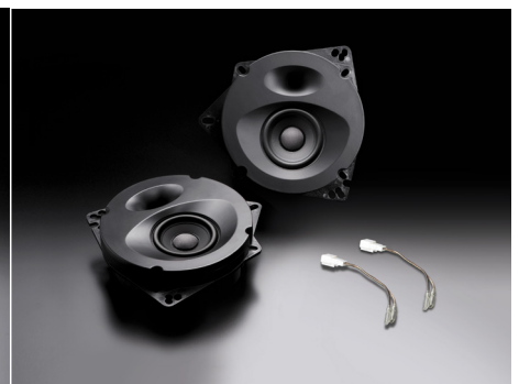
SP-N81E (フロント/リア両用)