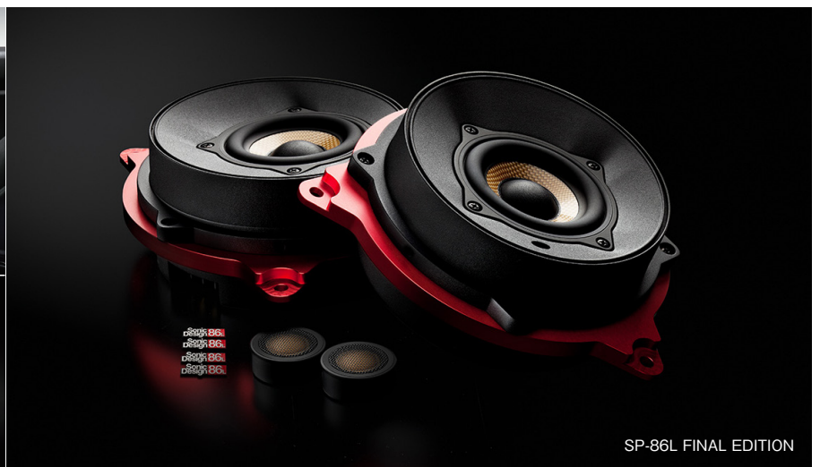
SP-86L FINAL EDITION

車両への装着画像(左上)は合成によるものです。製品は純正グリル内に装着されるため、実際にはスピーカーユニットは見えません。