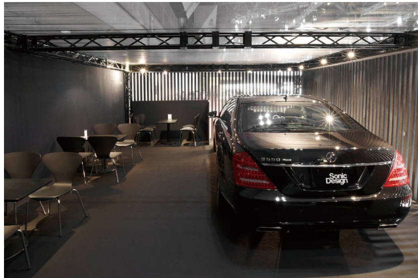
第43回東京モーターショー2013 ソニックデザインブース「The Suite Lounge」内部参考画像（画像は前回開催時のもので、展示車両や什器類などは実際と異なります）

**ブース内部はお取引先様のための商談スペースとなっており、一般公開はしておりません。