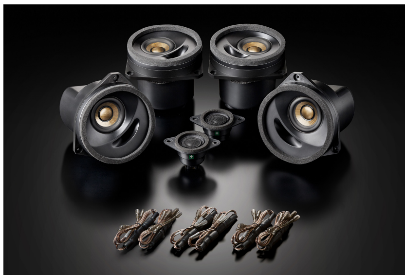
SonicPLUS SUBARU 「SFR-S01F」

対応車種（各機種共通）：LEVORG（VM系、2014/H26年～）、SUBARU XV（GP系、2012/H24年～）、インプレッサ SPORT/G4（GP/GJ系、2011/H23年～）、WRX（VA系、2014/H26年～）