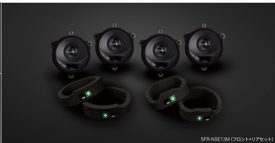
SFR-NSE13M (フロント+リアセット)