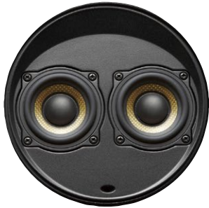
D52R デュアル 52mm フルレンジ ドライバー・モジュール 本体価格 300,000円 (ペア) + 税