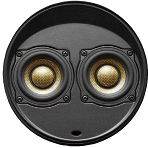
D52N デュアル 52mm フルレンジ ドライバー・モジュール 本体価格 620,000円 (ペア) + 税